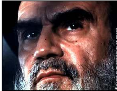
روح الله خمینی و سیداحمد خمینی

روح‌الله خمینی به عنوان صادر کننده فرمان قتل عام و احمد خمینی به عنوان نویسنده متن حکم قتل عام و پیگیری کننده اجرای آن، نقش اساسی در این کشتار بزرگ داشتند. فرمان خمینی برای قتل عام زندانیان مجاهد در شش مردادماه ۶۷ صادر شده است. در شهریور ۱۳۶۷ حکم جدیدی برای قتل عام زندانیان مارکسیست صادر شد که متأسفانه تاکنون متن آن انتشار نیافته است و مشخص نیست حکم شفاهی بوده یا کتبی. متن فرمان خمینی برای قتل عام زندانیان مجاهد به شرح زیر است: